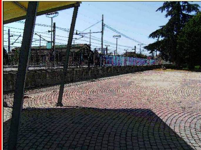
Piazzale Giovanni Paolo II